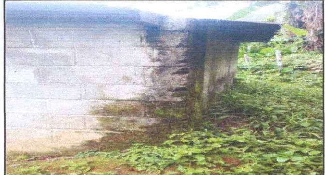
Foto 4: Cambio de entechados y costaneras y repello de sanitarios.