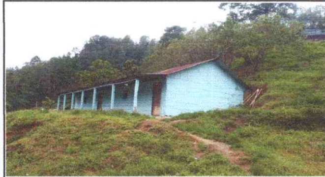
Foto 3: Módulo a reconstruir necesidad que cubrir, cambio de entechado, costaneras, piso y columnas del corredor.