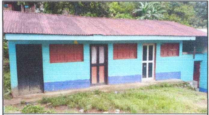
Foto 2: Entechado, cambio de costaneras levantado de altura, cambio de puertas y ventanas.