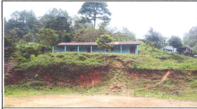
Foto 1: Vista frontal aula a reconstruir y necesidad que cubrir, cambio de entechado, costaneras y piso.